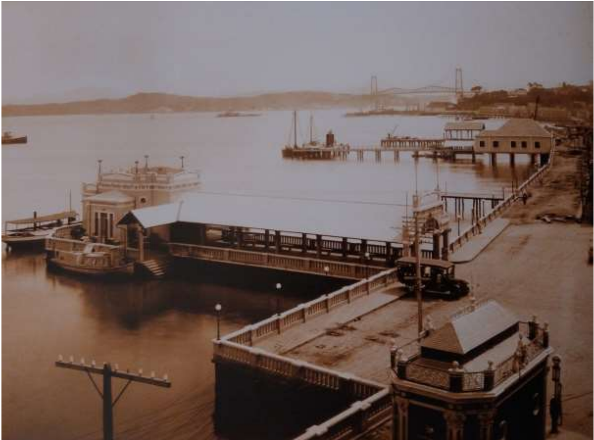
Figura 3: Miramar recém inaugurado em 1928.