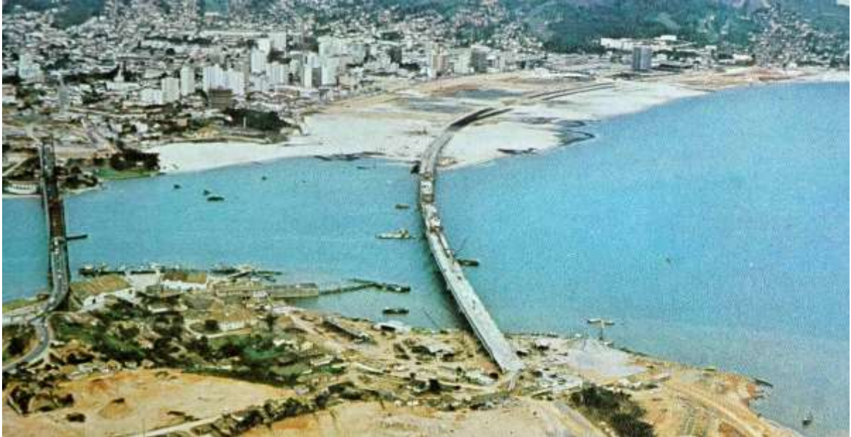
Figura 4: ponte Colombo Salles (à direita) e Aterro Baía Sul vistos a partir do continente (década de 1970).